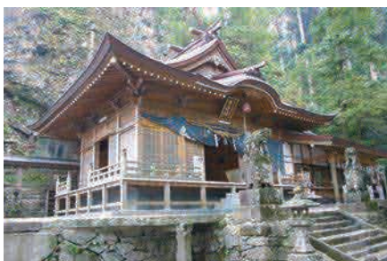
天狗に会える? パワーを感じる神社 [MAP]P14G-5

英彦山は、古来より神の山として信仰されていた霊山で、御祭神が天照大神の御子天忍穗耳尊(あめのおしほみのみこと)であることから、「日の子の山」即ち「日子山」と呼ばれていました。