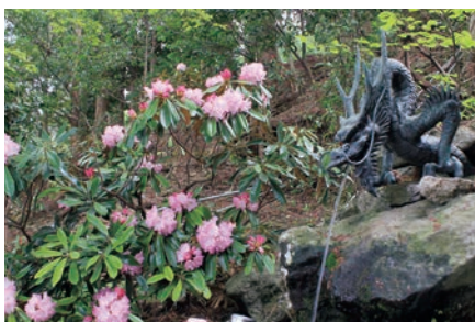
奉幣殿そばにある英彦山神宮御竜神水 [MAP]P14G-4

九州名水百選の英彦山神宮御竜神水は、不老長寿の御神水といわれ、「圓通の瀧」より流れ出ています。