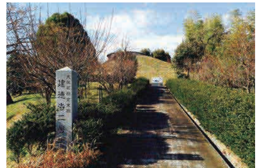
坂を上るとこんもりとした古墳をぐるっとみるができます