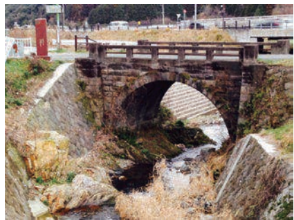
100年以上がんばっている橋、渡ってみませんか？