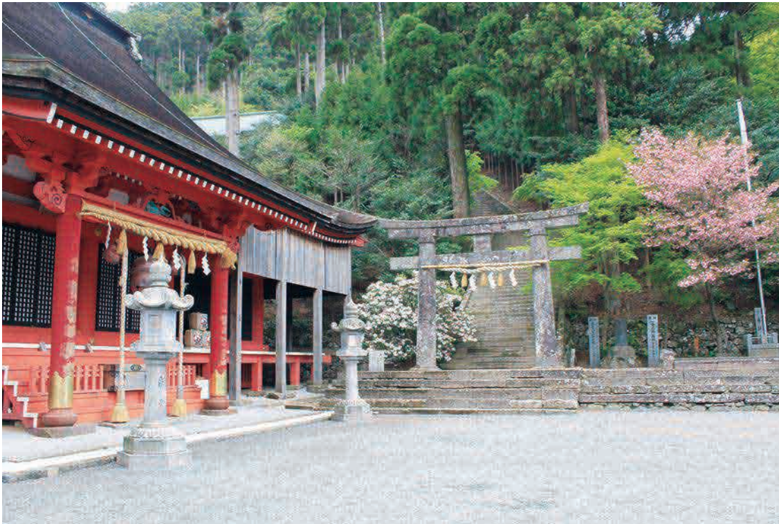
英彦山神宮奉幣殿 修験道時代の霊仙寺の大講堂。現在の建物は元和2年(1616年)小倉藩主細川越中忠興によって再建されたもので、国の重要文化財にも指定されています。この奉幣殿までは、石段を上らずにスロープカーでも行くことができます。