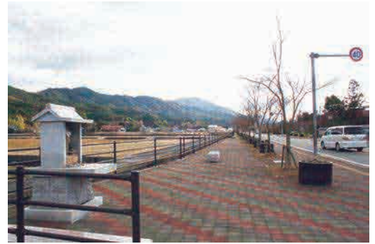
道の反対側には旧国鉄添田線大任駅のなごりが残る交通公園