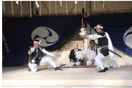
馬追鎌を奉納の場面。真剣をつかったこの迫力

5月の連休、川崎町の各地でも神幸祭が行われますが、1153年、源為朝が、田川郡勾金に移り、この付近の領主になった時、正八幡神社に杖築の48手を奉納し、源氏の興隆と武運長久を祈ったのが、杖築の始まりとされています。真剣を用いた勇壮な舞が見ものです。主な開催場所は田原882番地