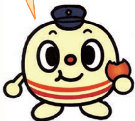
ふくち★リッチゼラート

子どもたちにも大人気の平成筑豊鉄道のキャラクターちくまるくん！かわいいオリジナルグッズもいっぱい！！ぜひGETしてください。詳しくは「へいちくネット」で検索！