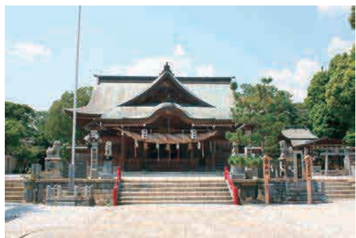
田川市に来たらぜひお参りしてほしいパワースポット