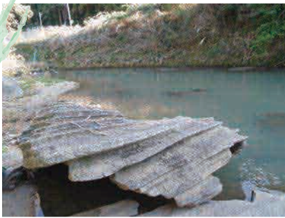
県道34号線を脇道に入り山浦畑地区の今川にあります。少々わかりにくいですが看板が目印 [MAP]P15D-4

戸代城の美しい姫「小夜姫」。思いを寄せていた家臣に裏切りで城攻めにあい、最期は今川に身を投げました。この岩は、その小夜姫が大蛇となり大岩に巻き付いたまま死んでいったという伝説から蛇巻岩とよばれています。