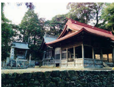
急な石段が苦手な方はスロープで [MAP]P15A-3