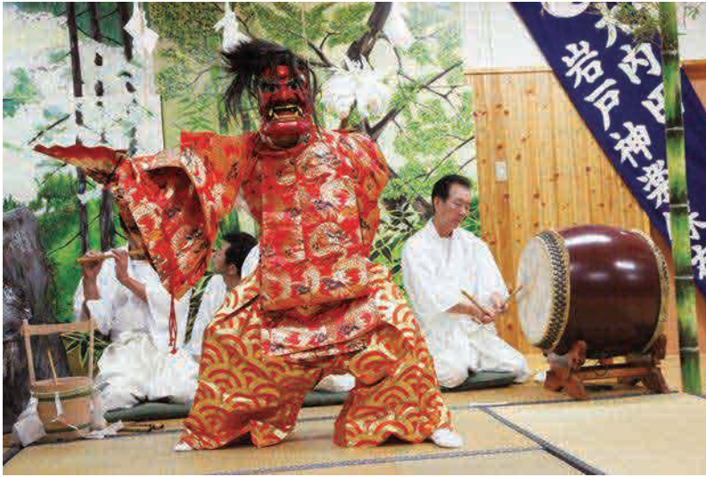
4月26日（土）20:00～、大内田研修センター（赤村大字内田 3535）で神楽がおこなわれます。 ※毎年4月第4土曜日開催 [MAP]P15C-4

その始まりは、大内田地区に牛馬の疫病が流行し、困り果てた村人が氏神様の大祖神社に伺いを立て、「おみくじを引いたところ、「4月に神楽をすればよい」とのお告げが。それ以来、「家が3軒になるまでやめない」という万年願として行われるようになりました。