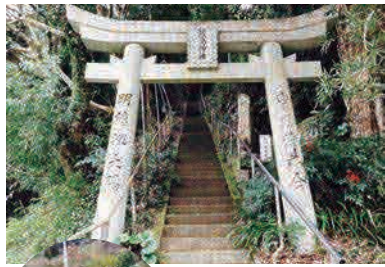
鳥居の向こうにまっすぐのびる強靱的な階段にちょっと躊躇…

地元では「黒木の淡島さま」と呼ばれ親しまれ、安産、婦人病、子どもの夜尿症などに御利益があるといわれています。藤江氏魚楽園近くにある標識から脇道を上って行き、赤い欄干が目印。町内だけでなく遠方からも訪れる方が多い淡島神社は、5月3日の大祭に餅なげが行われ、たくさんの方で賑わいます。