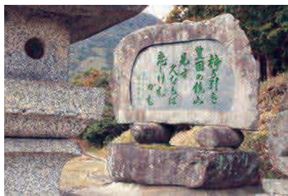
鏡山大神社参道にある按作村主益人の歌碑 ※1 [MAP]P15B-3

万葉歌碑 香春町は奈良時代、太宰府へ続く「田河道」の宿駅として栄えていました。万葉集に記された短歌七首を刻んだ歌碑、文人たちや歴史で知られた文物を顕彰した記念碑などが多数あります。