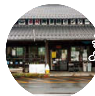
自慢のお弁当が待っています!