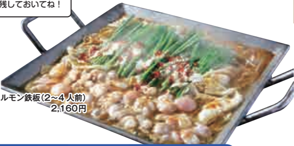
九州産黒毛和牛 ホルモン鉄板(2~4人前) 2,160円