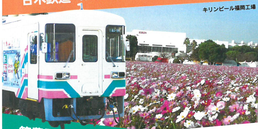
キリンビール福岡工場