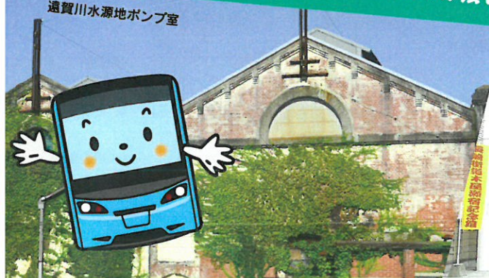
通賀川水源地ポンプ室