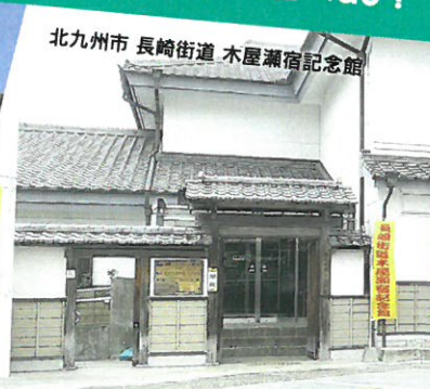
北九州市 長崎街道 木屋瀬宿記念館