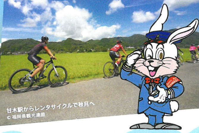
甘木駅からレンタサイクルで秋月へ