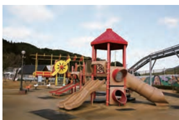
歓遊舎ひこさん ふれあい広場（添田町）

歓遊舎ひこさんにある無料の公園（一部有料）食堂・パン工房その他特産品やお弁当など。