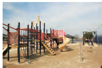
ワイ・ワイ・ワ広場 （福智町）