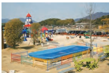
親子ふれあい広場 （大任町）

歓遊舎ひこさんにある無料の公園（一部有料）食堂・パン工房その他特産品やお弁当など。