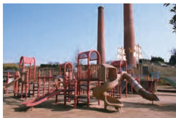
石炭記念公園（田川市）