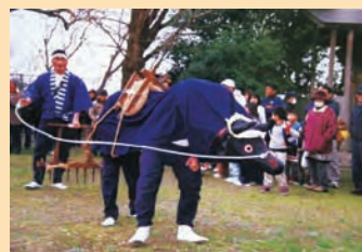
田植祭のようす【3月】