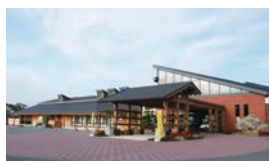
福智町しあわせ天然温泉郷