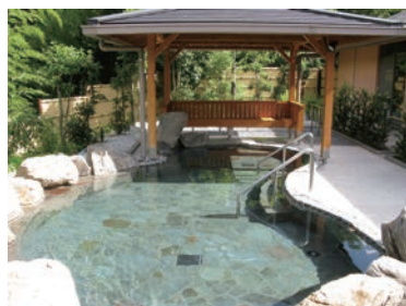
特設内の2百畳の大広間には屋台があり、レストランも大人気です。

四季で表情を変える自然に包まれた「源じいの森温泉」。2浴場を日替わりで楽しめ、どちらも内湯と露天風呂、大型サウナを設備。静かな時間の中、電気風呂やジャグジー露天があなたの心と体を癒します。