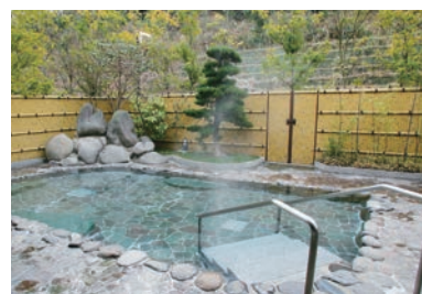
内湯の洗い場も広々とした空間を確保。フルフラットの障がい者用風呂も備えます。

ゆとりある空間づくりをテーマにした天然温泉。子供からお年寄り、体の不自由な方など、すべての人にやさしいユニバーサルデザインとバリアフリー構造が基調。ゆとりある空間の中でだれもがくつろげます。