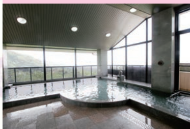
福智登山後の利用にも最適