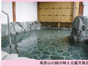
英彦山の緑が映える露天風呂