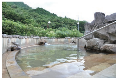
澄んだ空気の中、全国でも珍しい2種混合泉の効能と柔らかな泉質をお確かめください。