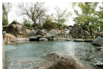
源泉が二つあるので、奇数月と偶数月で泉質が変わります。それぞれの効能と泉質をお楽しみください。

大浴場や露天風呂、薬石浴(嵐風の湯)など、日本最大級の道の駅にある温泉施設。直径約3ミクロンの気泡で白色になったシルキー湯、釜風呂など内容も充実。特に開放感あふれる豪快な露天風呂は、季節の風を感じながらゆつたりとくつろぐことができます。