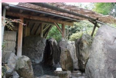
療養が主の国内有数の温泉