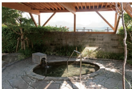
展望も美しい掛流しの露天風呂です

【場所】香春町柿下290 【MAP】P15.C-3 【時間】AM10:00-PM10:00 【休み】第1・第3火曜日 【☎】0947-32-5551