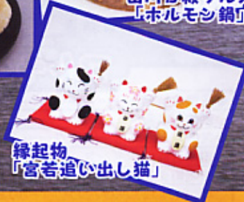
縁起物 「宮若追い出し猫」

主催 筑豊フェア2009 実行委員会 共催 嘉飯都市圏活性化推進会議・田川地域観光推進会議 チラシ作成：福岡県立嘉穂総合高等学校 普通科情報総合コース