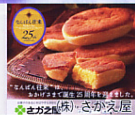
25 “女人ばなは” おかげさまで誕生25周年を記念して さかえ屋(株)