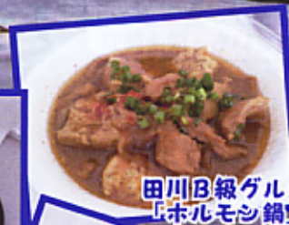
田川B級グルメ 「ホルモン鍋」