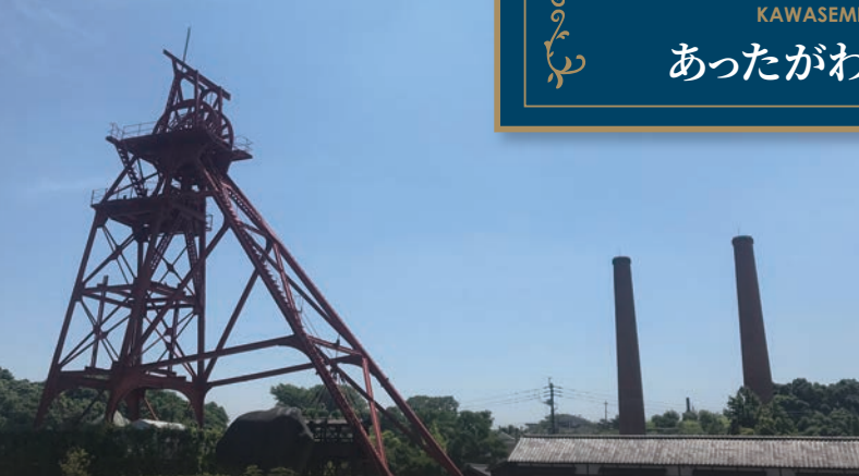
※写真はすべてイメージです