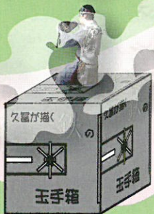
久富 達也 (絵画)