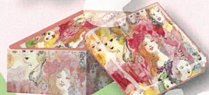
ウエノ アイ (絵画&ぬいぐるみ)