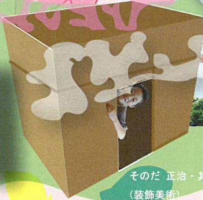
そのだ 正治・其田 寿枝 (装飾美術)