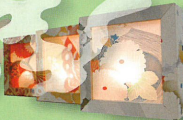
くま本 伴 (オフィス伴画館)