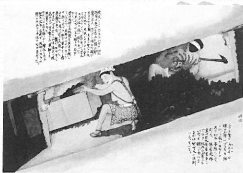
▲炭丈六〇センチ以下の切羽での採炭