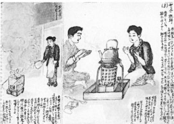
▲ヤマ人の燃料(3)(ゴトクと殻焼き)