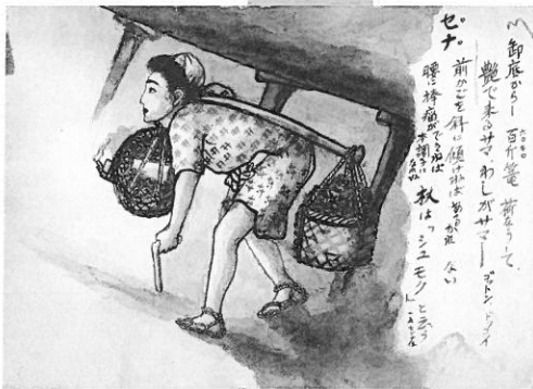
▲セナを担う女の後山