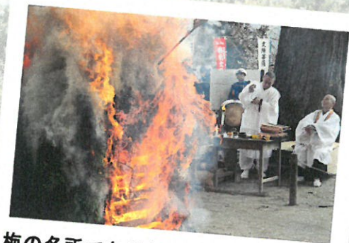
梅の名所である神宮院の護摩焚きが 見学できるスペシャルコースです