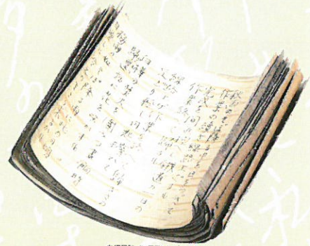
白樺日記（※展示はレプリカです）