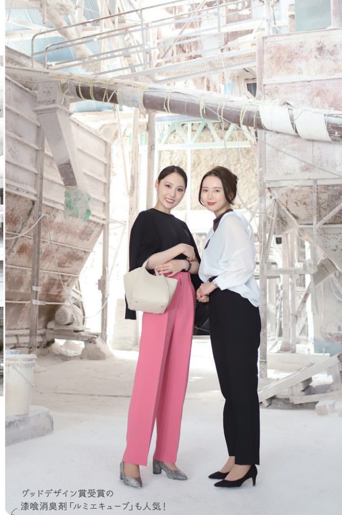
グッドデザイン賞受賞の漆喰消臭剤「ルミエキューブ」も人気!

ま るで一面銀世界のような空間。降り積もる石灰が神秘的な景観をつくりだしているのは、漆喰珪藻土メーカー「田川産業株式会社」。どこを切り取っても絵になる工場内は、いくつものPVのロケ地に使われるほど。工場見学も実施しているので、五千年の歴史を持つ「漆喰」の文化と製造工程を学んで、悠久の時に浸ってみませんか。 田川産業の漆喰は大阪城など多くの文化財に使用。また最新技術で作られたタイル「Limix」は渋谷ヒカリエをはじめ現代建築にも使用されています。