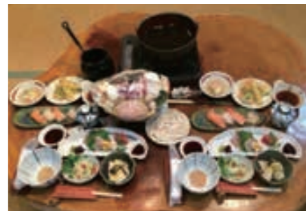
ちゃんこ鍋コース1人前 2,376円(2人前より承り)

日本でただ一軒だけ、名大関「貴ノ花」の名前を屋号とする老舗。大相撲九州場所の開幕時には、店舗の裏側が貴乃花部屋の宿舎になる。