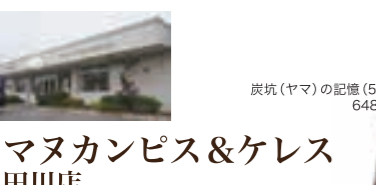
炭坑(ヤマ)の記憶(5P) 648円

田川市魚町10-4 ☎0947-85-8468 11:00~17:00 木・日・祝祭日(たまに不定休)