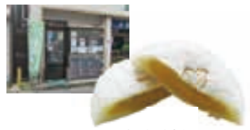
さつまいもあん 100円

大任町今任原1339 ☎0947-63-3005 10:00~19:00 不定休