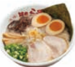
昭和(むかし)ラーメン 820円

香春町香春1021-3 ☎0947-32-3953 11:00~25:00 なし