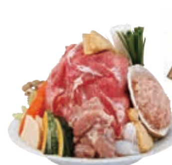
山賊鍋1人前 2,415円(2~3人前あります)