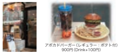
アポカドバーガー(レギュラー:ポト付) 900円(Drink+100円)

田川市伊田町9-15 ☎0947-42-0986 9:30~18:30 日祝(祝日は予約販売のみ)