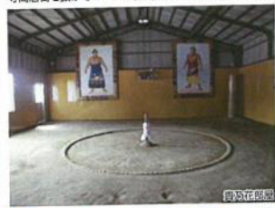
相撲茶屋貴ノ花 貴乃花部屋の力士が稽古で使用する土俵の見学ができます。現役力士と記念撮影ができるかも申しられません。

貴乃花部屋の宿舎となっている相撲茶屋貴ノ花で土俵を見学し、総合運動公園・後藤寺商店街を抜けてゴールの田川後藤寺駅を目指すコースです。