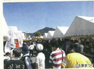
ふる里まつり 添田町の特産品や姉妹町 の北海道美深町の特産品も販売しております。

添田町の秋のイベント「ふる里まつり」や、添田町めんべい工場を通るルートです。添田町で採れた新鮮なお野菜や特産品を販売している道の駅歌遊舎ひこさんも楽しみいただけます。